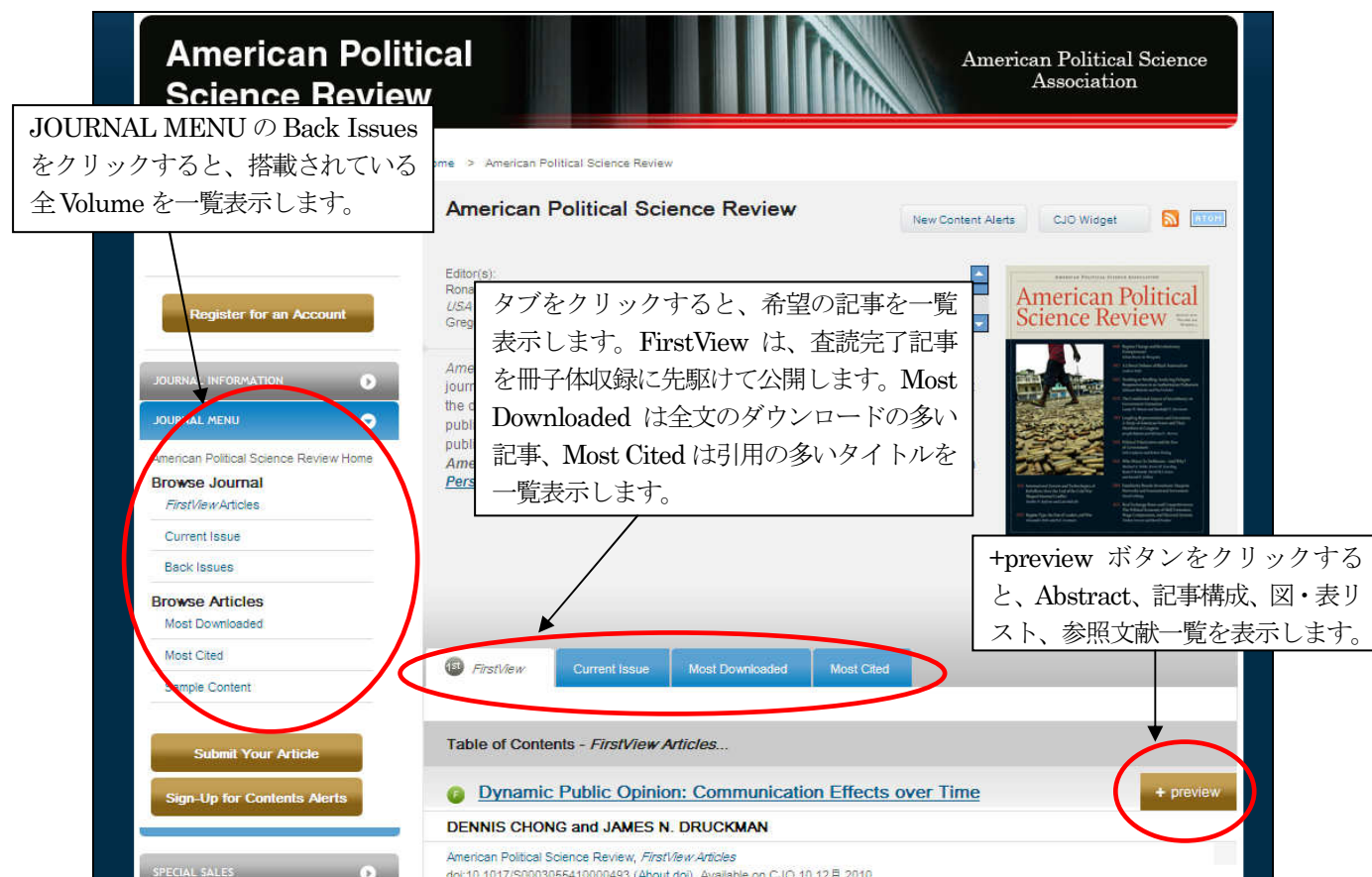
ジャーナルホーム画面（例：American Political Science Review）

記事の閲覧方法は、ジャーナルホーム画面中央のタブメニューから希望の方法を選択するか、画面左の JOURNAL MENU をクリックして、希望の方法を選択します。バックナンバー一覧については左側の JOURNAL MENU にあります。